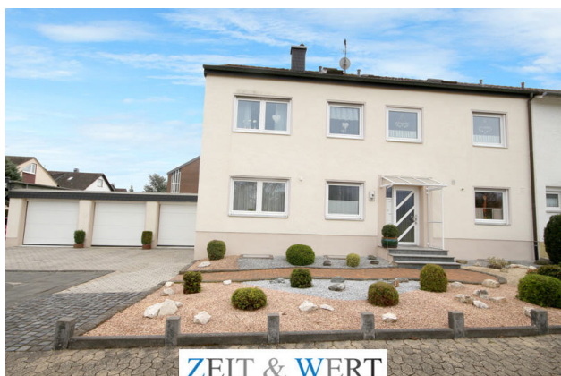
ZEIT & WERT I m m o b i l i e n Maklersocietät GmbH