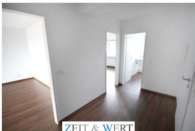
ZEIT & WERT I m m o b i l i e n Maklersocietät GmbH