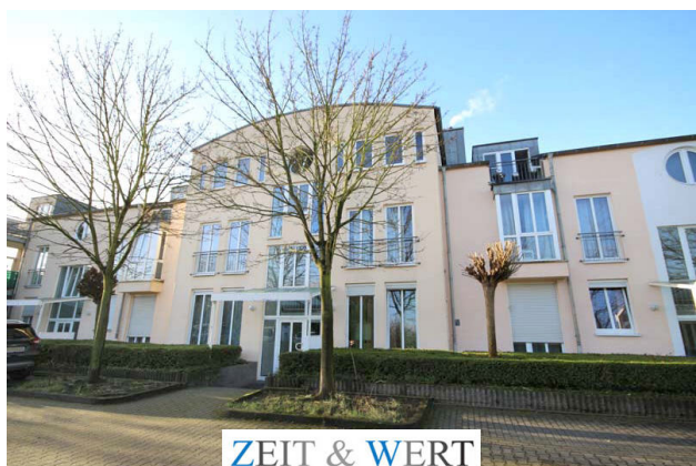
ZEIT & WERT I m m o b i l i e n M a k l e r s o c i e t ä t G m b H