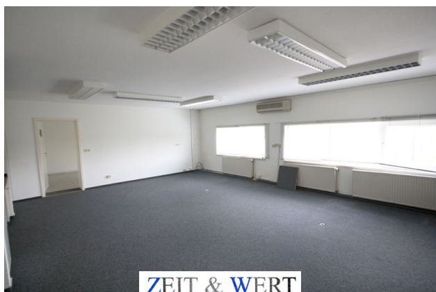
ZEIT & WERT I m m o b i l i e n M a k l e r s o c i e t ä t G m b H